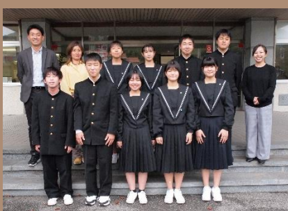
左)旧生徒会役員のみなさん、右)新生徒会役員のみなさん 3年生の人数が少ない代でしたが、最後まで学校をリードしてくれました。