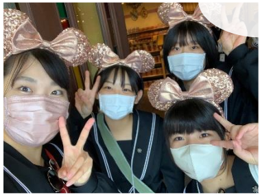
あいにくの雨でしたが、念願のディズニーシーを楽しみました。夢の国では男子も女子も耳が生えるらしい。