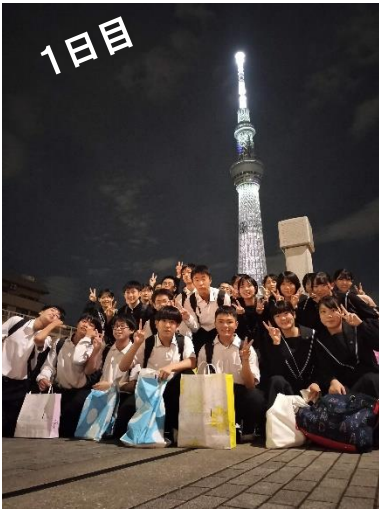
スカイツリーの下で。道路の真ん中で通行人に見守られながらの一枚。笑

一日目は、松山空港から東京へ旅立ちました。飛行機に乗るのが初めての生徒も多く、離陸時には「キャー」と歓声(?)があがったり、みんな興奮気味な様子。最初の目的地は東京スカイツリー。少しガスがかかっていて、富士山までは見られませんでした。上空から見る都会の景色を楽しみました。