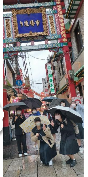
最終日は横浜に移動して、「カップヌードルミュージアム」の見学と「横浜中華街」での自由散策。