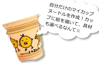
自分だけのマイカップヌードルを作成！カップに絵を描いて、具材も選べるなんて☆