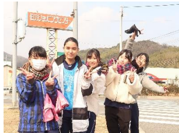
3年生がサポートします