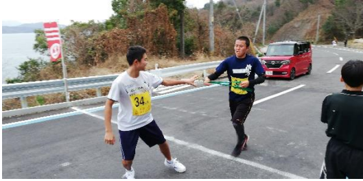
2区から山登りの3区へ

1月12日（日）、有志による3チームが出場しました。非常に起伏の激しいコースでしたが、特訓の成果もあり、全チームが完走することができました。区間2位の好記録を出した生徒もいました。