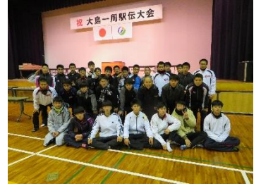
来年も頑張ります！