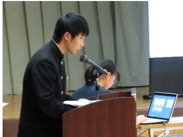
発表にも熱が入ります