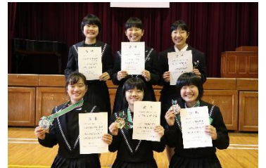
女子は1年生が健闘しました