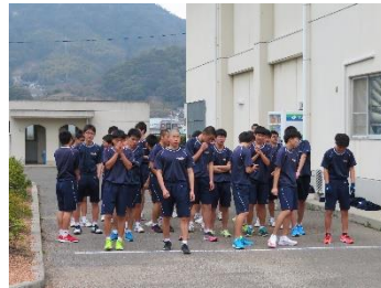
緊張のスタート前