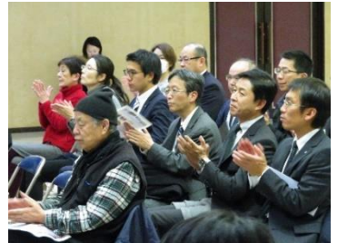
充実した時間でした