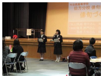
司会やアドバイス役で緊張しました