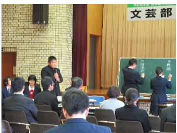
持ち味を生かしたディベート（高文祭）

11月17日（日）に県高文祭に参加し、伯方分校の持ち味を生かした句作りやディベートを披露することができました。また、2月2日（日）には、西条市中央公民館で開催された地域教育東予ブロック集会に参加し、歓迎アトラクションとして句会を開き、好評を博しました。